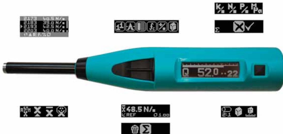
SilverSchmidt con una selezione delle diverse schermate

La struttura di menu è semplice, simile all'interfaccia di un cellulare. Ogni comando può praticamente essere attivato direttamente o con un massimo di due fasi successive. In tal modo è possibile selezionare il metodo di misurazione (modalità di impatto singolo – diverse modalità per il calcolo della media) e la curva di conversione desiderata (forza compressiva con fattore di forma e unità / valore di rimbalzo Q). Tutti i dati sono memorizzati automaticamente e possono essere visualizzati tramite l'elenco dei dati.