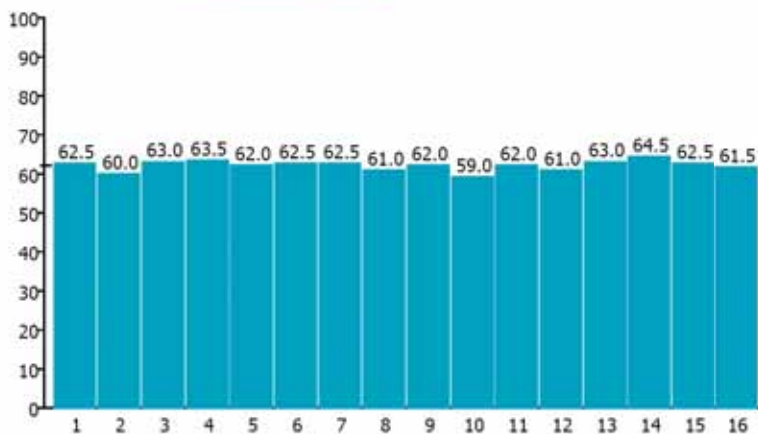
Q-Values diagram [measurement order]

Il software Hammerlink su base Windows, sviluppato da Proceq SA, sfrutta tutte le capacità del SilverSchmidt, rendendolo lo strumento più potente per la valutazione strutturale (solo versione SilverSchmidt PC).