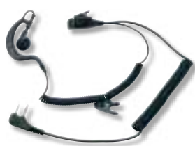
Microfono auricolare con PTT standard

ABM Tactical cod. C855 con connettore ad L e presa a 2 pin