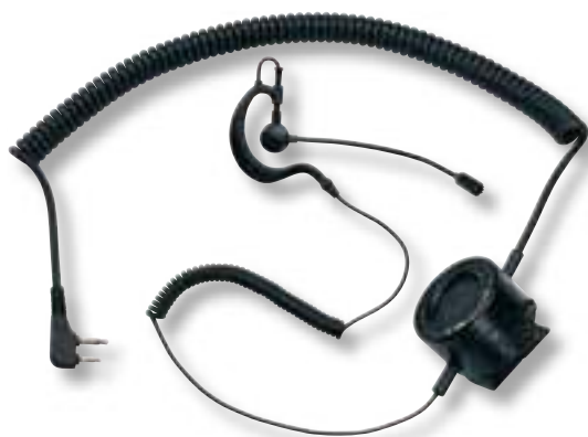
Microfono con braccetto regolabile e PTT tattico

ATM Tactical cod. C857 con connettore ad L e presa a 2 pin