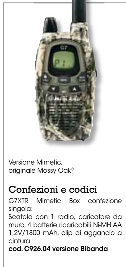
Versione Mimetic, originale Mossy Oak®