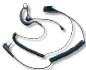
Microfono auricolare con braccetto regolabile e PTT

A21M cod. C858 con connettore ad L e presa a 2 pin