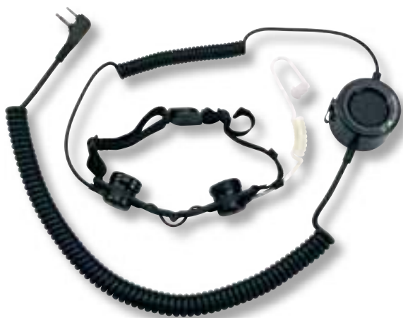
Laringofono con PTT tattico e auricolare pneumatico

ATM Tactical cod. C857 con connettore ad L e presa a 2 pin