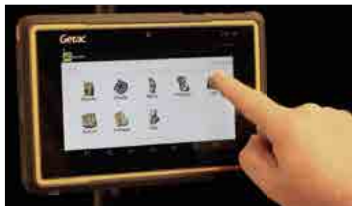
Icone di scelta attività