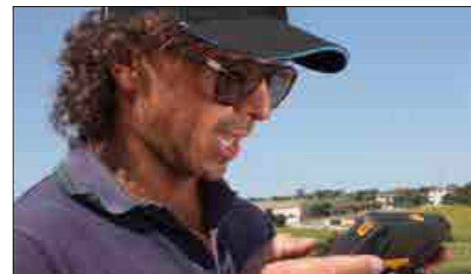
Detatura vocale appunti