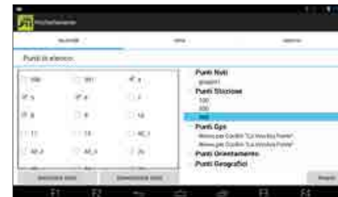
Punti da picchettare