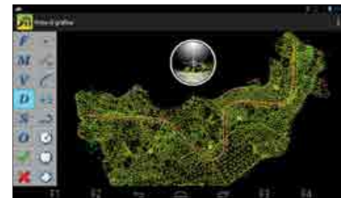
Grafica 3D - modello TIN