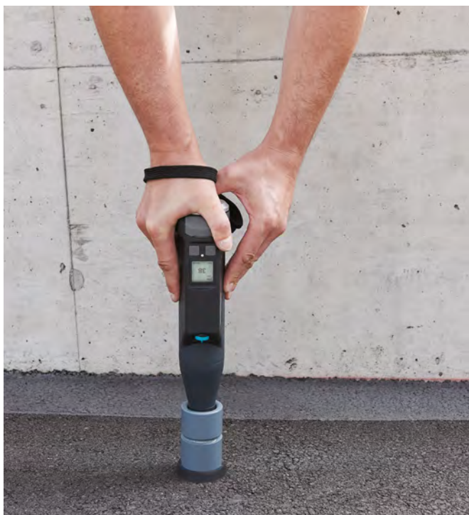
Original Schmidt Live con incudine di taratura portatile