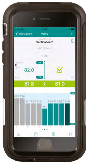
Schermata di verifica