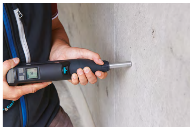
Original Schmidt Live con display digitale