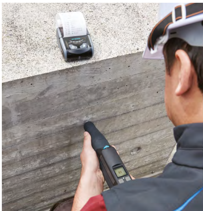
Original Schmidt Live Print con stampante Bluetooth