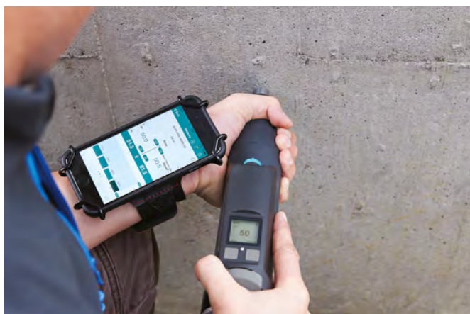
Original Schmidt Live con app iOS

Semplificando il lavoro, il vostro personale sarà più produttivo e otterrà più soddisfazione da attività molto laboriose in passato. Potrete svolgere le prove rapidamente, automaticamente e senza errori.