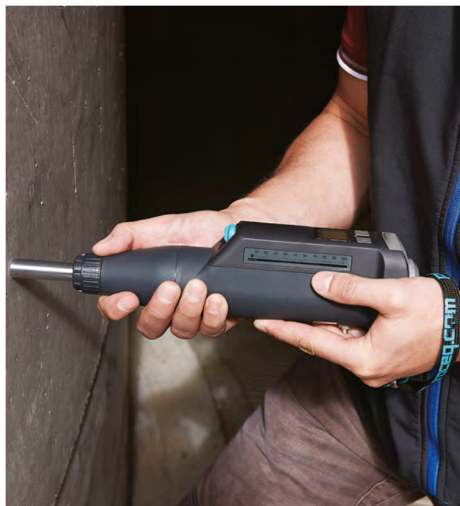
Original Schmidt Live con fascetta da polso

All'acquisto di un nuovo strumento è possibile prolungare la copertura della garanzia per le parti elettroniche fino ad un massimo di tre anni aggiuntivi. La garanzia supplementare deve essere richiesta al momento dell'acquisto o entro 90 giorni dall'acquisto.